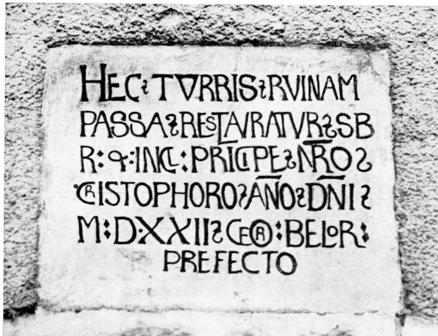
Inscription sur la porte Saint-Pierre

(La traduction de cette phrase latine est la suivante : Cette tour étant tombée en ruines fut restaurée sous notre vénéré et illustre Prince Christophe (Christophe d'Utenheim, Prince-Evêque de Bâle 1502-1527 en l'année du Seigneur 1522, alors que Georges Belorsier était châtelain de St-Ursanne).